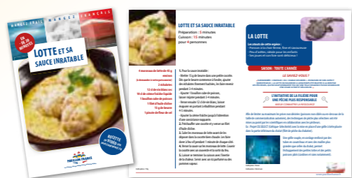
Fiches recettes avec 2 pages pédagogiques

*Etude menée en mai 2017 auprès de 2 950 chefs de rayon marée.