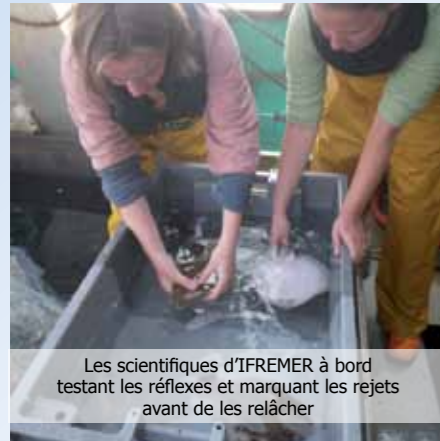
Les scientifiques d'IFREMER à bord testant les réflexes et marquant les rejets avant de les relâcher

Le projet ENSURE propose d'étudier ces questions sur les métiers des chalutiers côtiers ciblant la langoustine et différentes espèces de poisson, ainsi que les fileyeurs côtiers ciblant la sole.