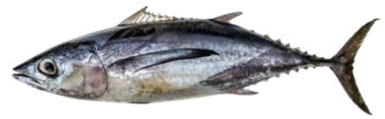
Provenance des débarquements français de Thon germon en 2024